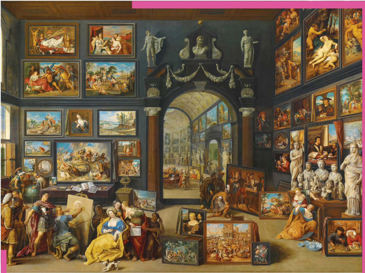
Apelles Painting Campaspe , Willem van Haecht, c. 1630